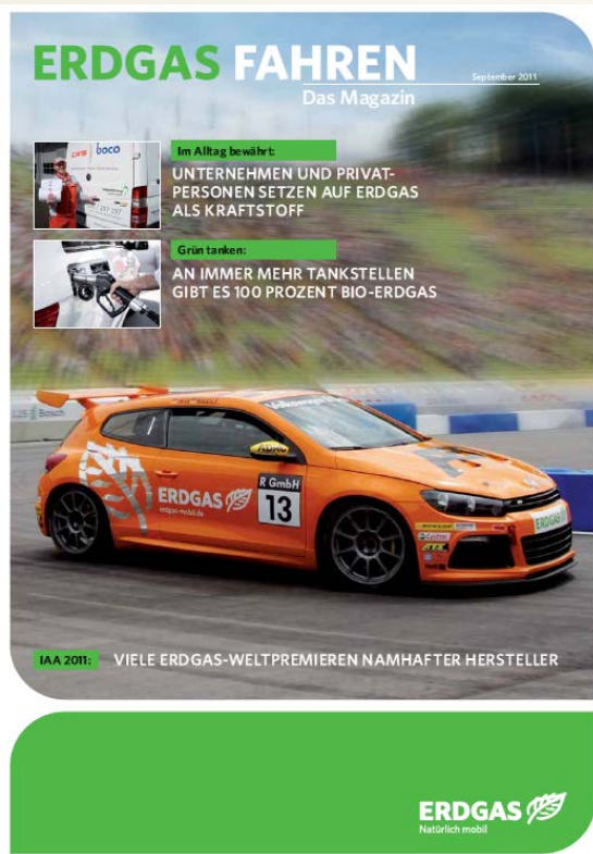
Magazin „ERDGAS FAHREN“, 09/11