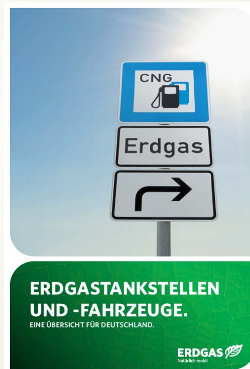
Tankstellenkarte (einlegbar in Imagebrochure)