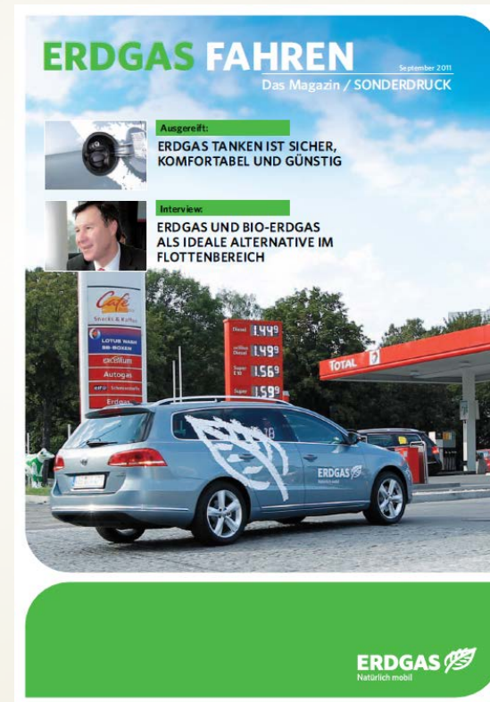
Magazin „ERDGAS FAHREN“ - Sonderdruck